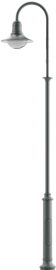
LATARNIA KLASYCZNA 2 szt.